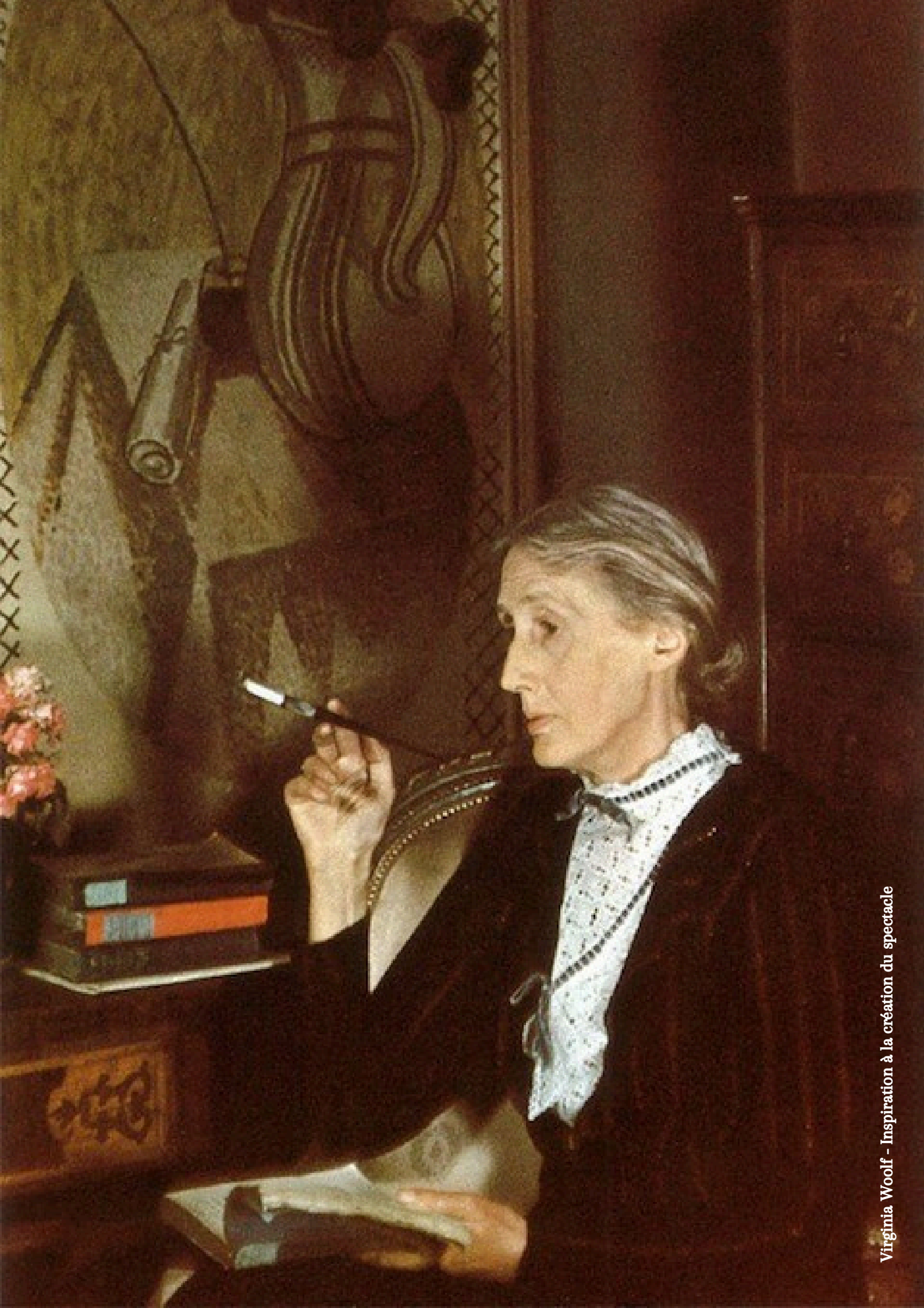
Virginia Woolf - Inspiration à la création du spectacle